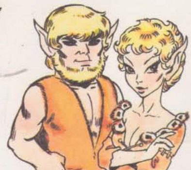
BALMSTUMPF — TALGLANZ